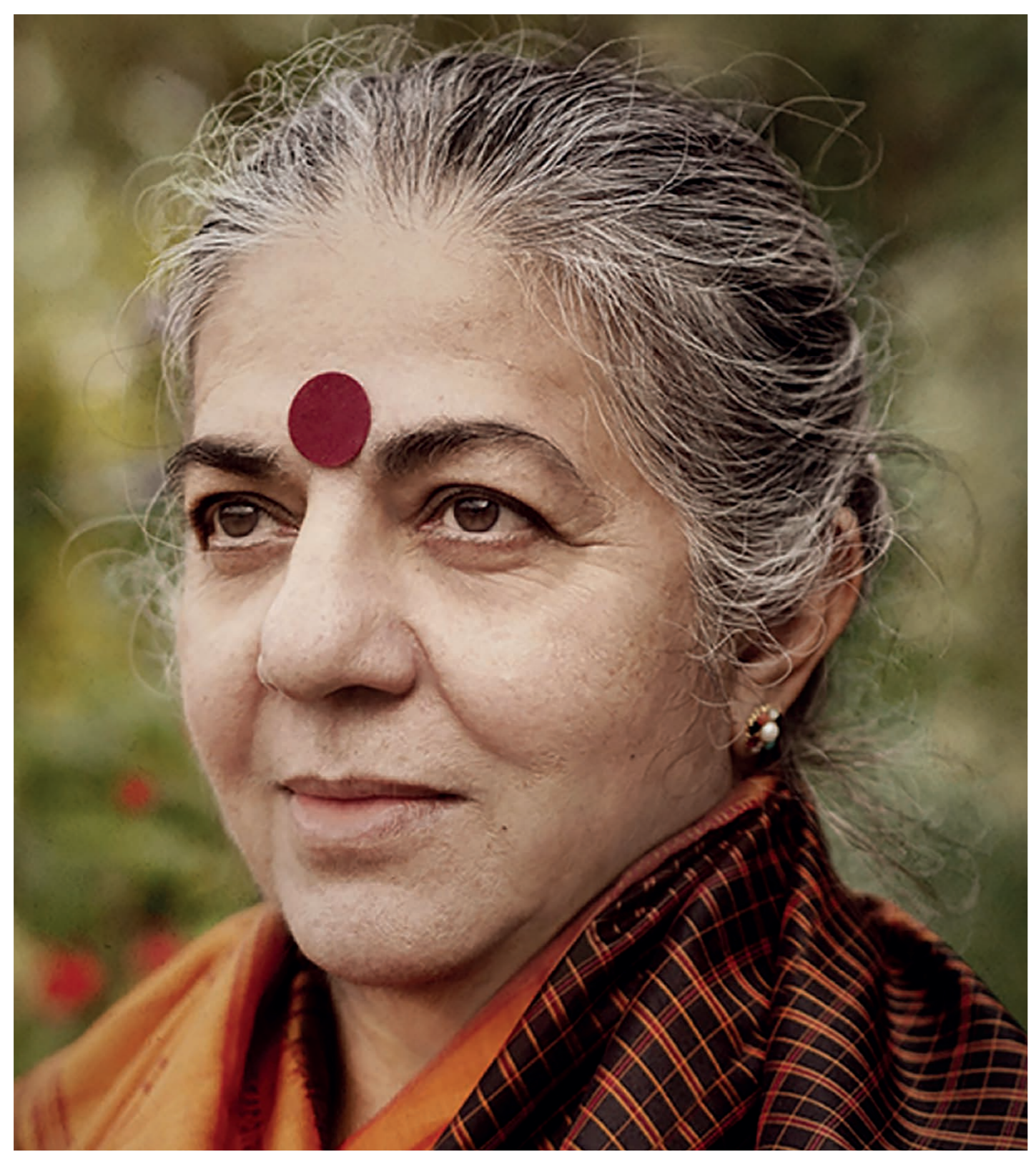
VANDANA SHIVA ACTIVISTE ENVIRONNEMENTALE, FONDATRICE ET DIRECTRICE DE NAVDANYA INTERNATIONAL

“ L'économie extractive basée sur les profits à tout prix nous a menés à un point de rupture écologique et à une société polarisée entre les 1 % les plus riches de la planète et les 99 % restants.