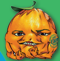
Illustration: Benoît Delmelle