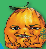
Illustration: Bernot Delmalle